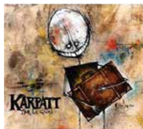
Karpatt sur le quai côte : 099 KAR