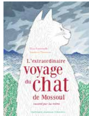
Elise Fontenaille, ill. Sandrine Thommen / L'Extraordinaire voyage du chat de Mossoul raconté par lui-même

« Il était une fois un chat extraordinaire, et ce chat, c'est moi ! Je vivais à Mossoul chez ma maîtresse, Samarkand, et je ronronnais à longueur de journée : le chat le plus heureux du monde ! Mais un jour, les hommes en noir ont envahi la ville. Nous nous sommes enfuis, nous avons traversé des frontières... »