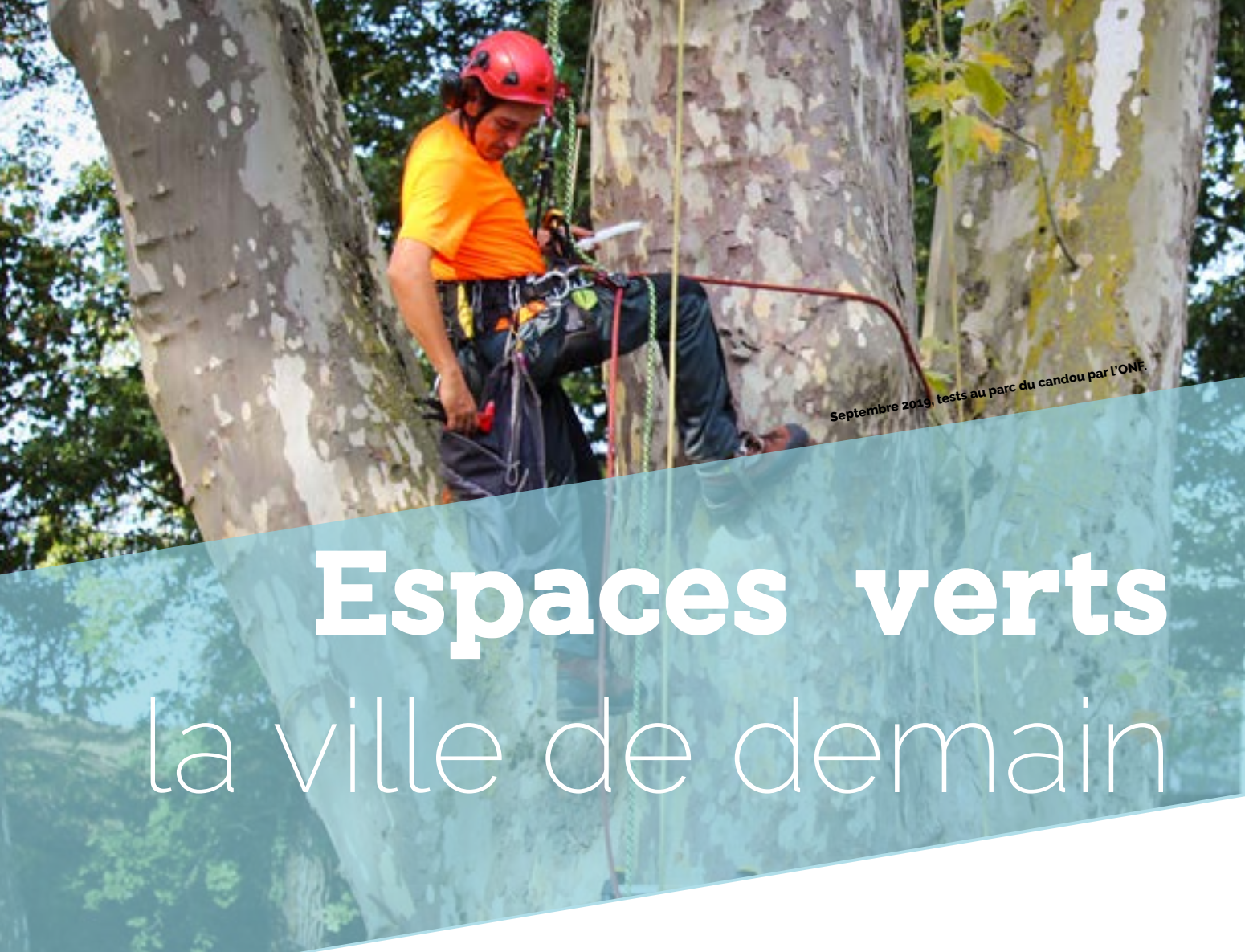
Septembre 2019, tests au parc du candou par l'ONF.