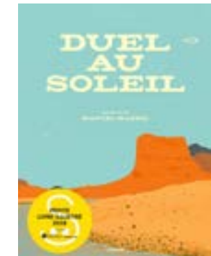
Manuel Marsol / Duel au soleil

D'abord nous voyons, comme à travers un zoom, les pieds, les mains avec les armes, les visages, puis de loin, l'indien et le cowboy. Le duel peut commencer ! Mais avec beaucoup d'humour, un incident vient constamment le perturber : un oiseau qui se pose sur le revolver, un nuage en forme de cactus géant qui passe, un train qui fait trop de bruit, leurs chevaux qui s'en vont flirter... Et le duel sera finalement remis au lendemain ! Manuel Marsol nous livre un album très coloré, au texte réduit à l'essentiel, à regarder avec attention, tant il fourmille de détails amusants tout en se jouant des codes du western. A lire dès 6 ans.