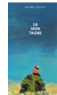
Manuel Marsol / La montagne Prix International de l'illustration foire du livre de Bologne 2017.