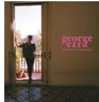
George Ezra / Staying at Tamara's